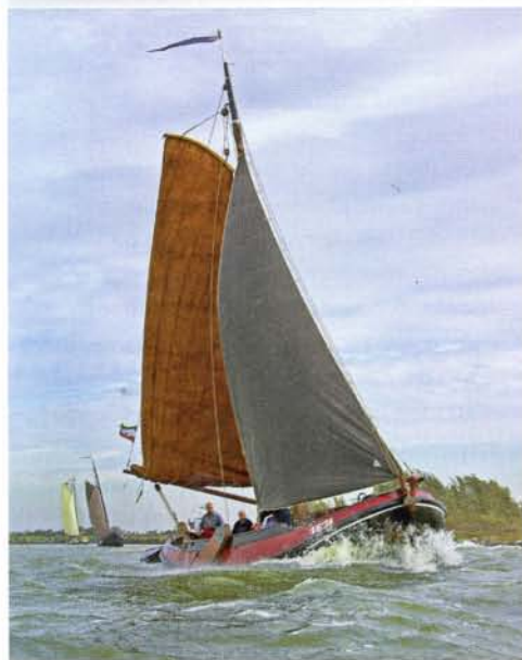
boven: De LE 74 heeft alle zeilen bij tijdens een wedstrijd tussen kleine vissersschepen