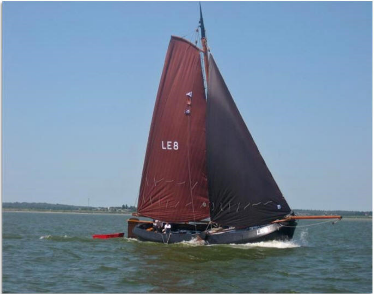
De bij Skipsbellings Blom gerestaureerde aak LE 8 (Doeske) van Klaas Postma

Blijkbaar ontdekte ook Jan Brilleman dat de aak 'Haast noch Rust' een ander schip was dan de LE 8 van Jan de Blauw.