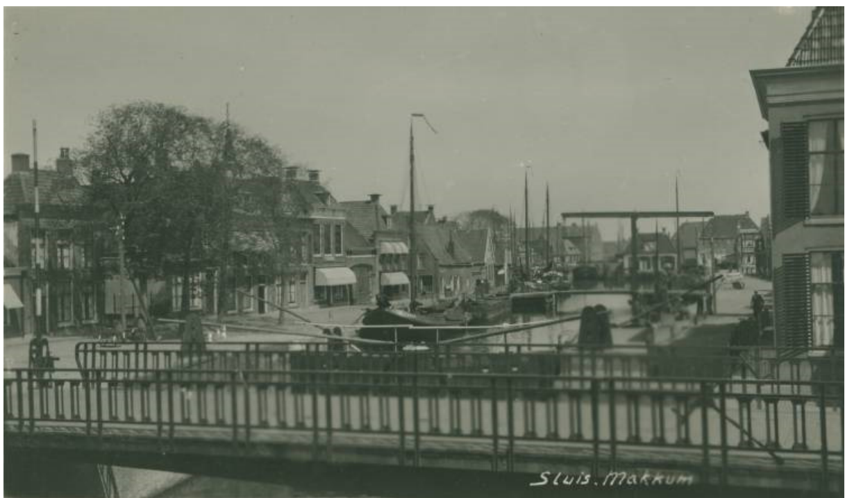
De aak GA 31 links vooraan in de haven van Makkum. Een grote aak van 49 voet (14 meter).