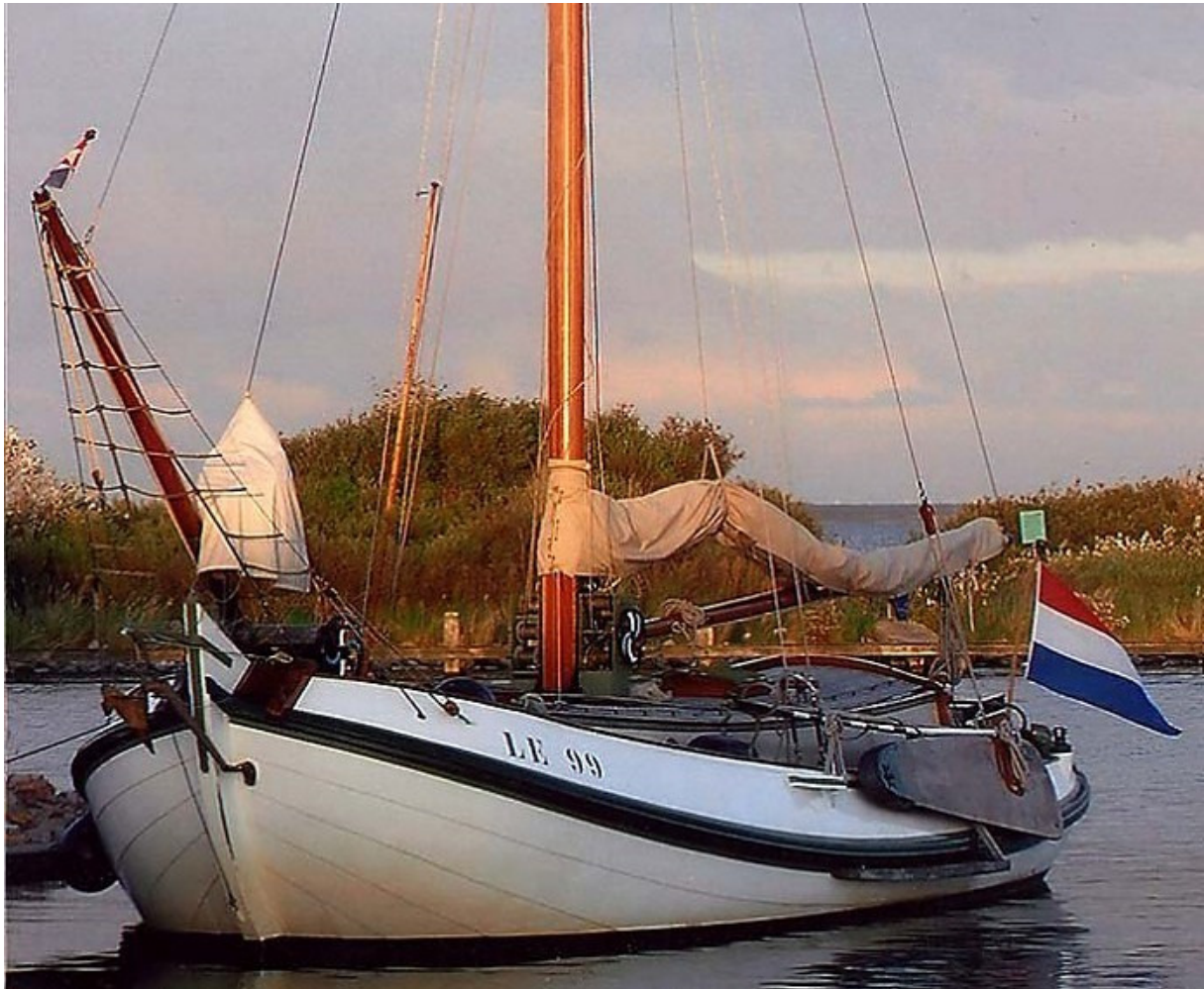
De Lemsteraak 'Haast noch Rust'. Zou dit echt de LE 99 zijn geweest?