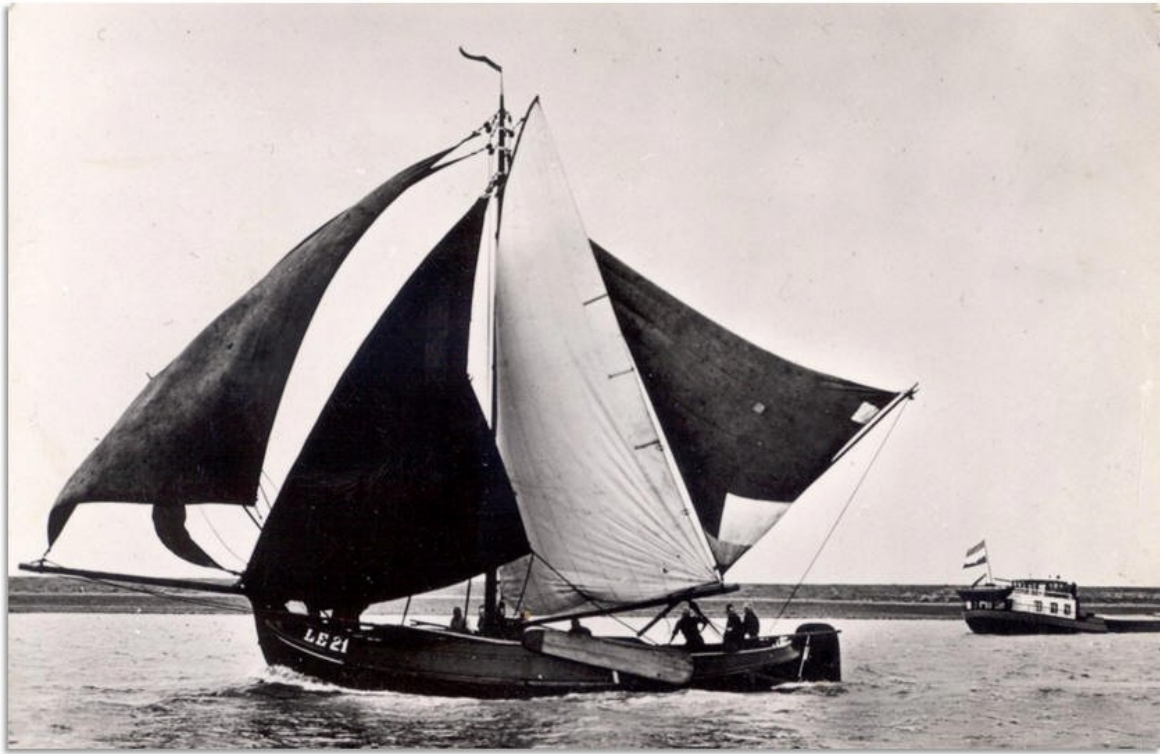
Lemmer, de LE 21 van Andries Fleer tijdens een zeilwedstrijd in de vijftiger jaren. Onder: de voormalige visaak LE 21 (ex-LE 78) als Lemsteraakjacht VB 48