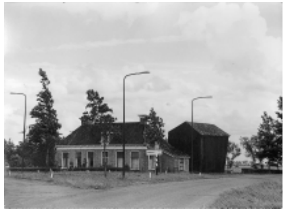
De kenmerkende driesprong “Lucht en Veld”

Ieder maand kwamen alle onderwijzers van Baarderadeel bij elkaar in de herberg “Lucht en Veld” op de driesprong Jorwerd-Baard-Mantgum. Onder gezag van burgemeester en schoolopziener werd er vergaderd. Er werden opstellen voorgelezen, rekensommen opgegeven en soms werd er gezongen. In de pauze werd er gekuierd, gekaatst of biljart gespeeld. Na de pauze werd de thee vervangen door jenever en brandewijn. In de levensschets van Van der Tol is het duidelijk dat