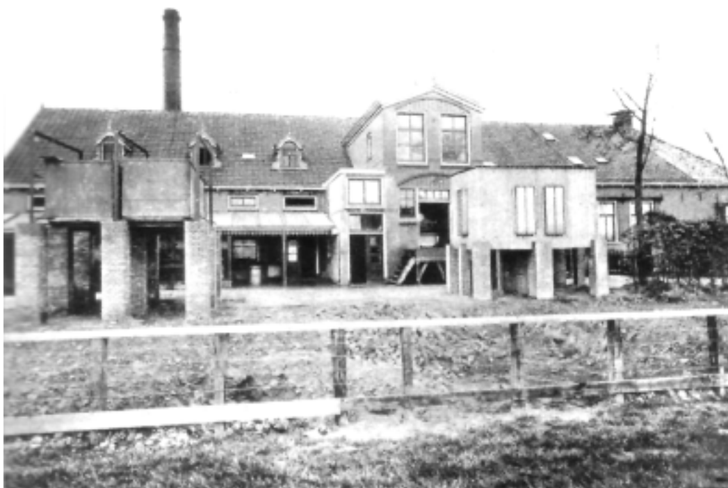
De stoomzuivelfabriek te Hilaard ± 1926