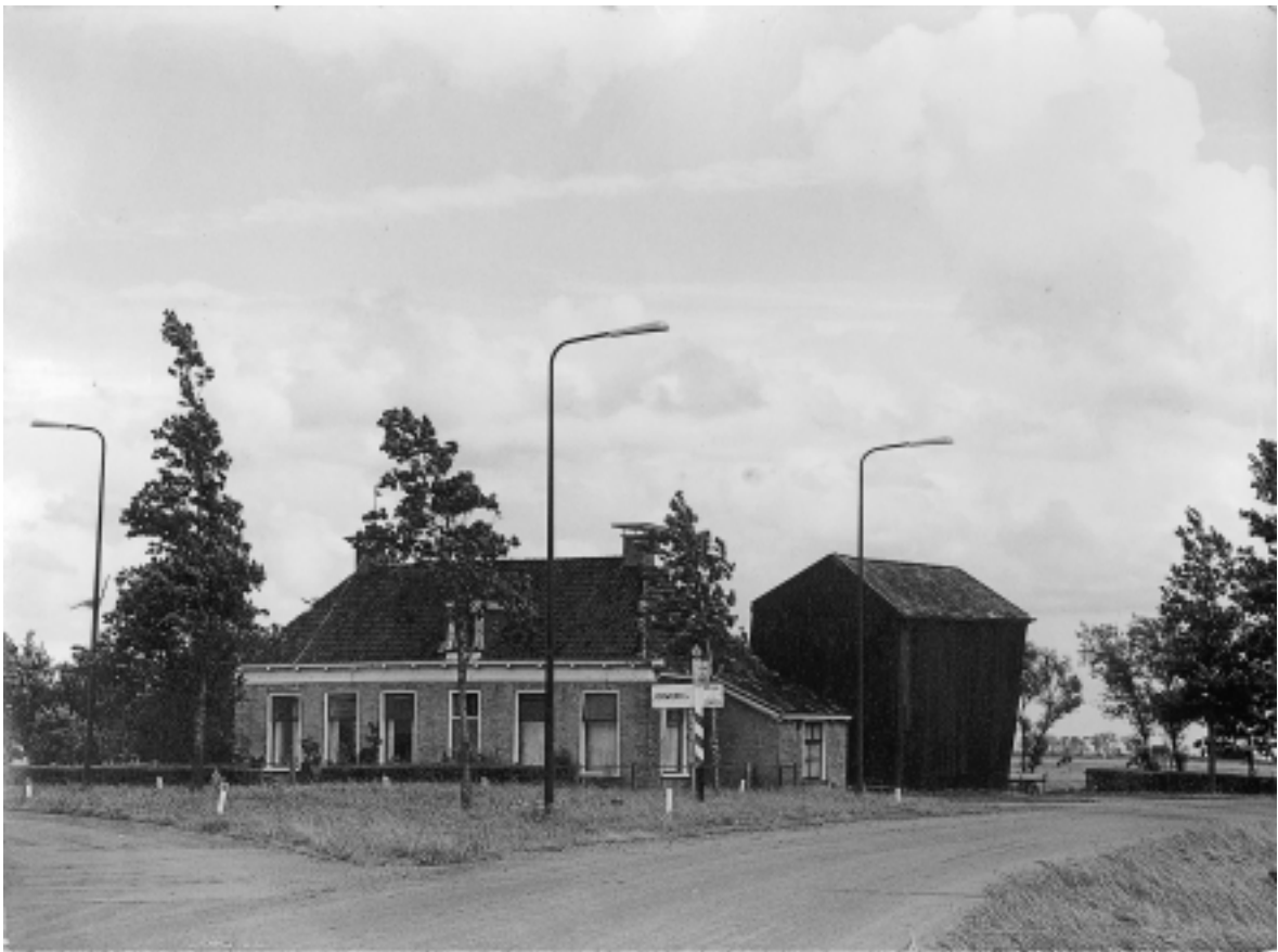
Foto van Lucht en Veld uit de jaren zestig van de 20 ste eeuw. Aan de linkerkant van de woning was de “trochreed” waar paard en wagen konden worden uitgespannen. De uitbouw rechts en de hooiberg daarachter zijn afgebroken. Ook de kenmerkende driesprong is sinds kort veranderd.