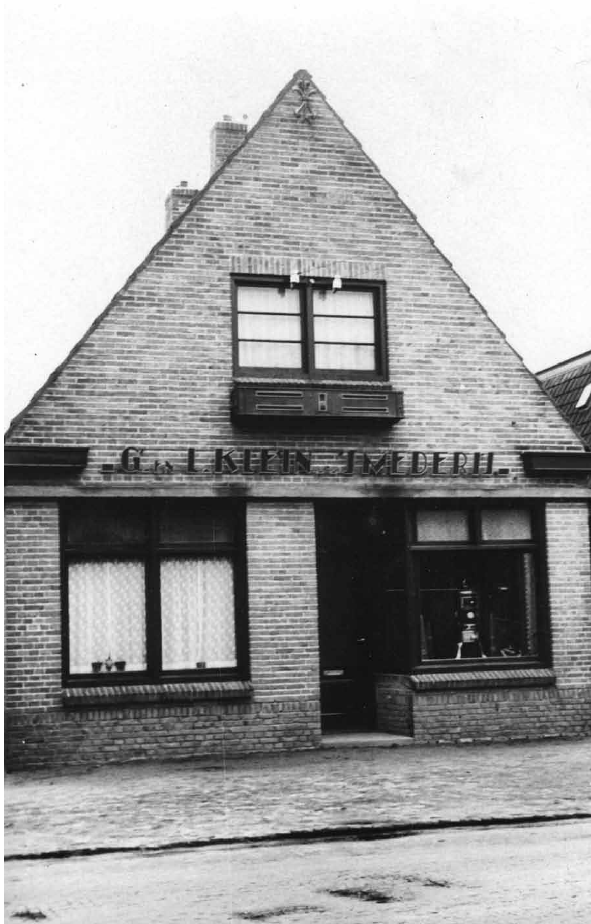
Woning met kachelwinkel eind jaren twintig. In de winkel is rechts nog net een kachel te zien.

te krijgen. 'In antwoord op uw verzoek d.d. 11 Mrt. 1937, alsmede een vervolg op mijn vorige aan U gerichte schrijven d.d. 21 Dec. 1936 (No 274-J-IV) heb ik de eer U hierbij te berichten dat er niets aan het door U in den handel gebracht trailer of oplegkoppeling mankeert.' De beide broers hadden duidelijk meer in hun mars dan alleen het werk van smid. Dat blijkt uit deze brieven die tevoorschijn kwamen uit trommeltjes en sigarenkistjes.