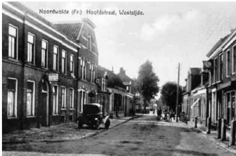
De Hoofdstraat West jaren twintig, met links logement De Dolfijn.