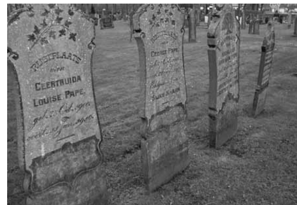
Graven van de familie Pape in Noordwolde.