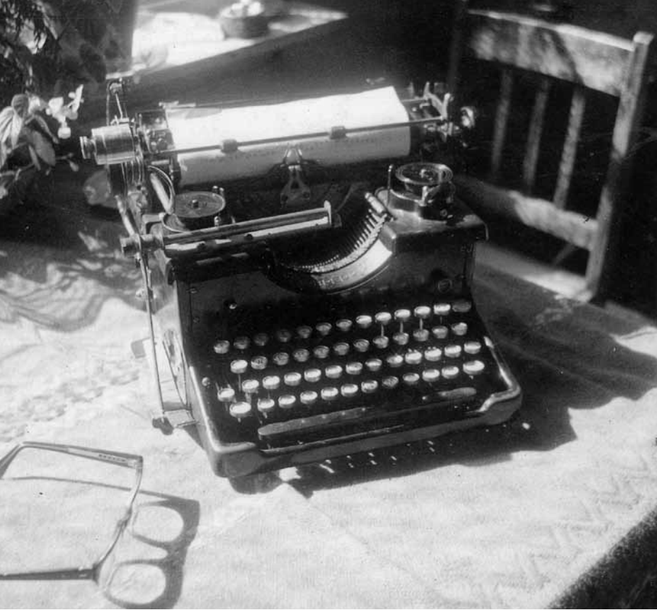
Deze muziekschrijfmachine werd in twintig jaar ontwikkeld en is te zien in een museum in Lemmer.