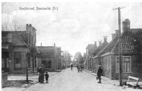
Hoofdstraat Oost rond 1920.