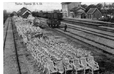
Station Peperga in 1908 met veel stoelen uit Noordwolde.

De regering Colijn bedacht in de jaren dertig grote projecten, die veel werk opleverden. Zo werd in mei 1932 de Afsluitdijk voltooid. Werklozen waren verplicht dit zware werk te doen. Ze kregen een laag loon en mochten maar eens in de twee weken naar huis. Om de Nederlandse producten in het buitenland goedkoper te maken, werd de gulden (pas) in 1936 in waarde vermindert. Van de sigaren die minister-president Colijn op een dag rookte kon een gezin een week leven. De werkverschaffing in Weststellingwerf betekende heide en woeste gronden ontginnen om er landbouwgrond van te maken, bossen aanleggen, sloten en vaarten graven en wegen aanleggen