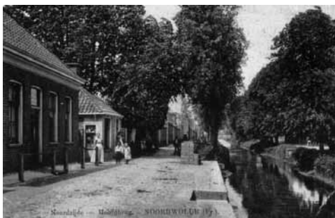
De vaart tussen Hellingstraat en Weemstraat in noordelijke richting tussen 1910 en 1920. De 'Triangel' is ditmaal door het loof van de enorme bomen niet te zien. Links snoepwinkel Wietske Kraan.