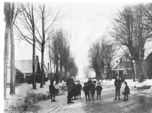
Schaatsen voor de 'Triangel' tussen 1901 en 1910.