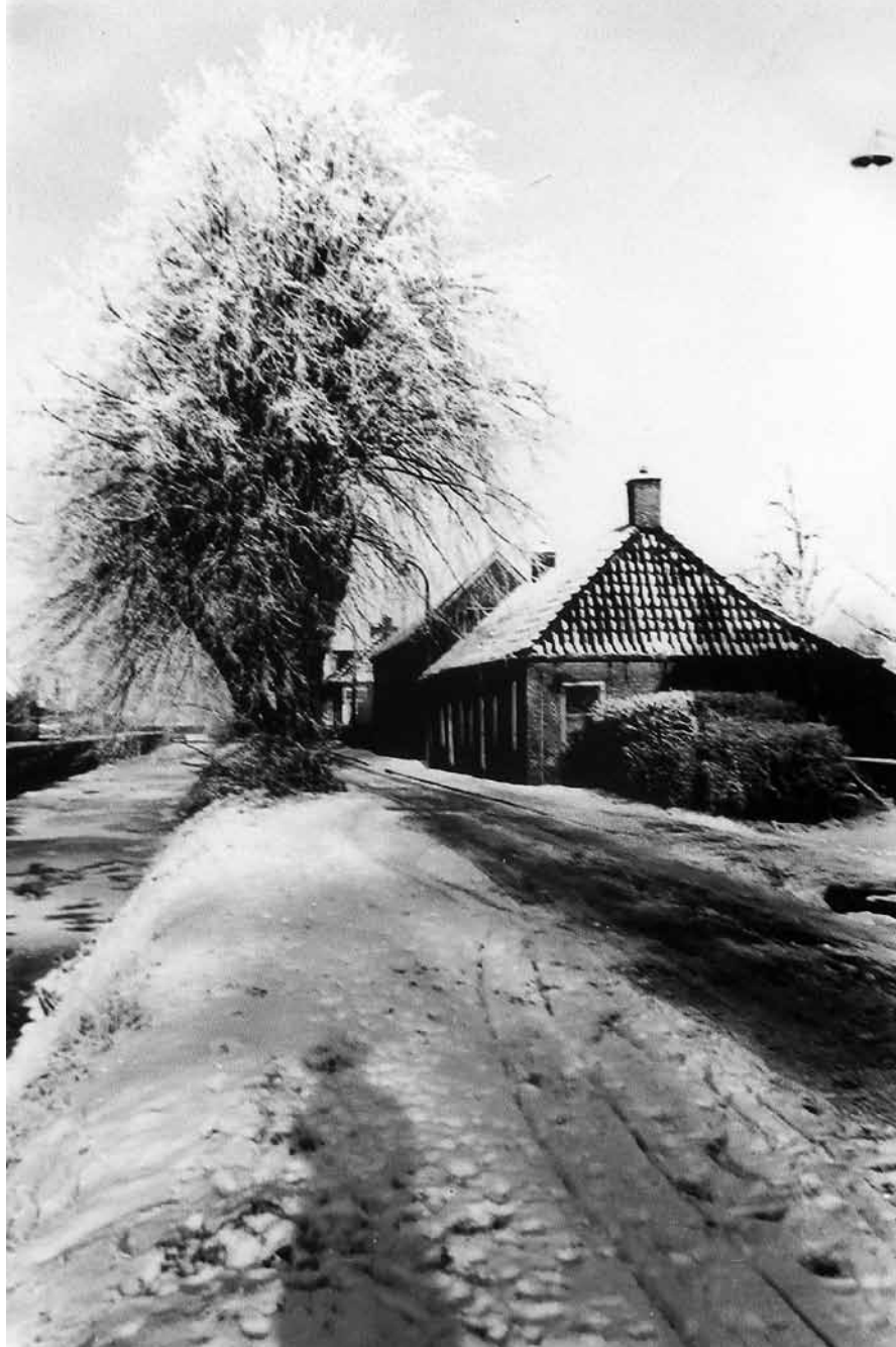
Winters plaatje van de 'Triangel' aan de Weemstraat. De vaart is bevroren.