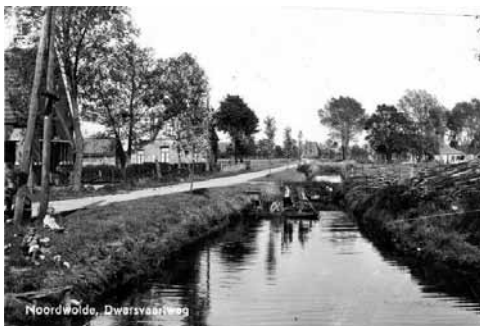
De Dwarsvaart jaren vijftig ter hoogte van huidige sporthal, waar jongens varen met een vlot.

bevonden zich twee bedsteden. Daar sliepen opa Lodewijk en zijn oudste dochter Wiep. Als opa van huis was om met zijn vlechtwerk de kost te verdienen, dan mochten daar een paar jongens slapen. Er werd haast om die luxe slaappleaats gevochten. Lodewijk liep met zijn mandjes en mattenkloppers het hele land door tot de Belgische grens. Zo miste hij ook de geboorte van zijn dochter Wiep, die daarom pas dagen later werd aangegeven.