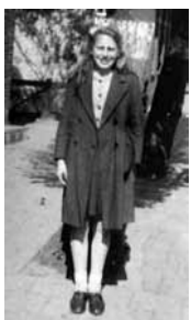
Klaasje als jong meisje.