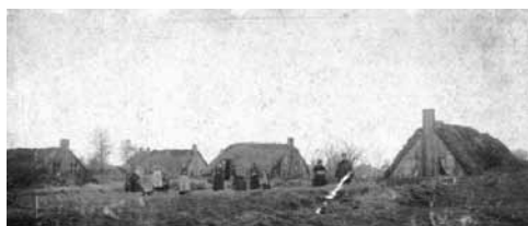
Plaggenhutten 'op Lombok' rond 1902, nu de Zuiderweg.