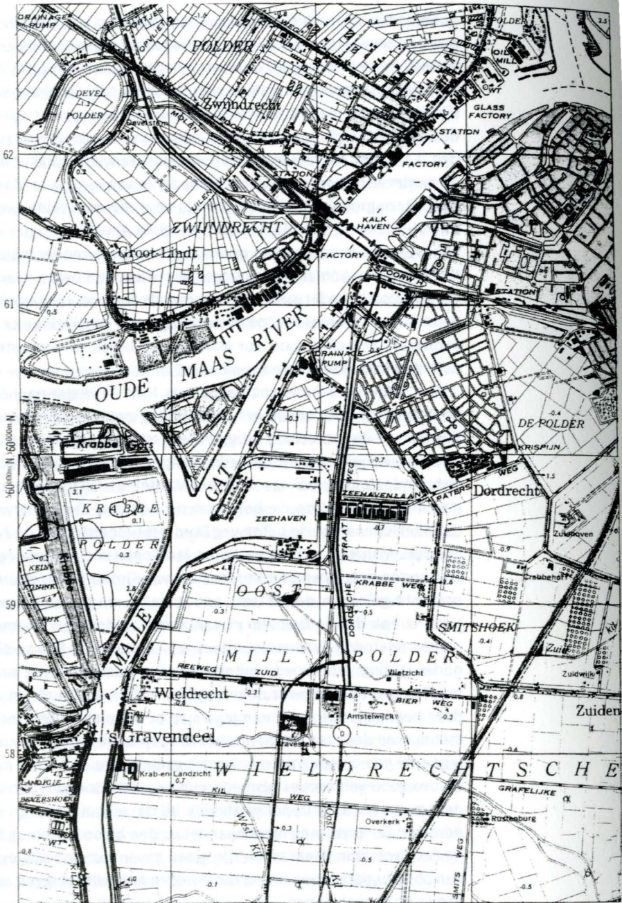
Overzichtskaart van het gebied tussen Dordrecht, Zwijndrecht en 's-Gravendeel.

(RAF-KAART UIT 1944, GEBASEERD OP VERKENNINGEN UIT 1942 EN 1943)