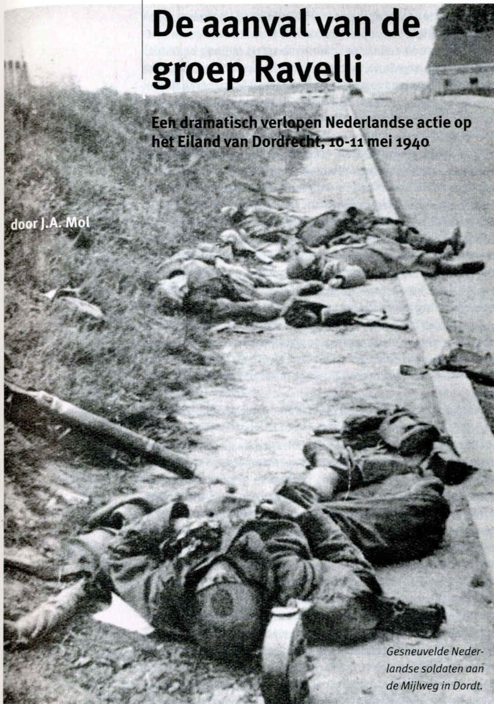
Gesneuvelde Nederlandse soldaten aan de Mijlweg in Dordt.