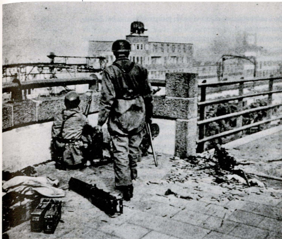
Duitse parachutisten op de Maasbrug bij Dordrecht.