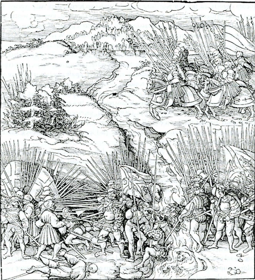
Afb. 2: Die Schlacht in Friesland: boutsnede van Leonbard Beck uit Der Weis Kunig, het heroïsche beeldverhaal over het leven van keizer Maximiliaan, samengesteld omstreeks 1515 door diens secretaris Marx Treitzsaurwein von Ebrentreitz en voor het eerst uitgegeven in Wenen 1775. Bij deze prent hoort een korte beschrijving onder de titel: Wie des Jungen weissen kunigs Hauptmann, der beruemt furst, auf die Springer zug und Sy schlug (cap. CLXXXIV). Die beroemde vorst is uiteraard Albrecht van Saksen, terwijl met de "Springer" de Friezen bedoeld zijn, ongetwijfeld als verwijzing naar het gebruik van de polsstok-piek door de Friese strijders. In het commentaar bij deze prent wordt steeds verwezen naar de slag bij Bomsterzijl in 1500, omdat Albrecht daar zelf bij aanwezig is geweest. Net zoals bij Laaxum wisten de Saksen ook hier de (nu opstandige) Friezen te verslaan door "ain Wasser" over te steken en ben in gesloten afdelingen achterna te jagen.

nabijgelegen klooster Hemelum zegt ook met zoveel woorden dat Warns de plaats van de slag is geweest. Volgens de auteur kwam het tot een treffen "in campum spaciosum prope villam Warns". 43 De volgende vraag is dan waar de genoemde gracht moet