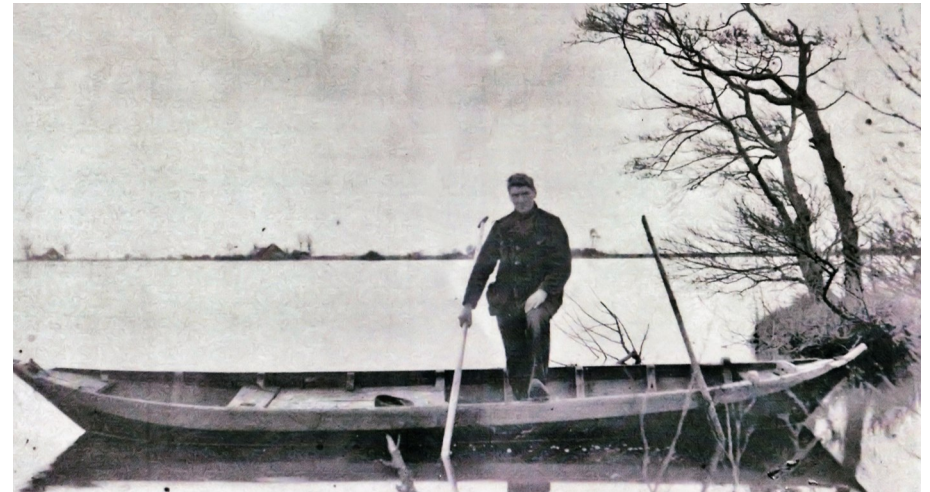
Visser op het Rohelster Wide.