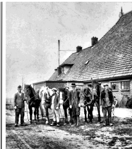
Paarden hielpen toen de boer.

eigendommen in het Rohelster Wide tegen taxatieprijs wilden afstaan aan de ontginningsmaatschappij.