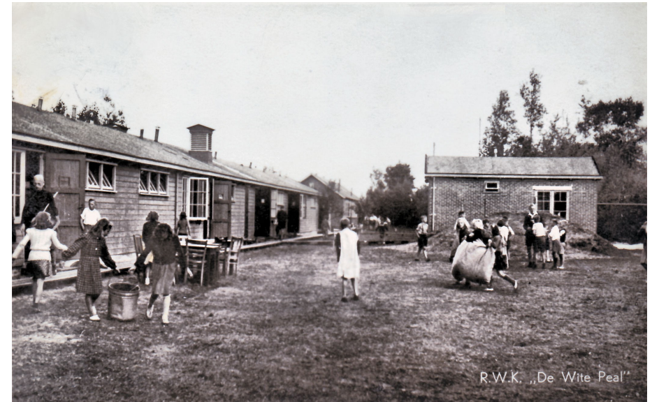
R.W.K. „De Wite Peal”

Duitsland hadden aanvaard, maar zonder geldige reden de arbeidsovereenkomst hadden verbroken. Als zij voor 1 april 1941 terug zouden keren of werk in Nederland hadden gevonden waren ze vrij man. Zo niet dan gingen ze naar een strafwerkkamp en moesten ze werken in o.a. de ontginning. Een keer in de 14 dagen mochten ze naar huis, hun distributiebescheiden moesten ze inleveren bij de kampbeheerder. De duur van het verblijf van deze contractbrekers kan nooit lang geweest zijn want korte tijd na de brief van april kwam er bericht dat de arbeiders per 1 mei het kamp hadden verlaten en niet weer terug zouden komen. Daarbij de opmerking "terwijl omtrent andere bezetting nog niets naders bekend is. Zodra zulks het geval zal zijn, hoop ik U te berichten". Wisten ze echt van niks? Voor Weststellingwerf in een brief op dezelfde datum wist de inspectie het wel. In Blesdijke zouden Joden komen! Waar bleven trouwens die vertrokken arbeiders? De inspectie van de Rijksdienst voor de