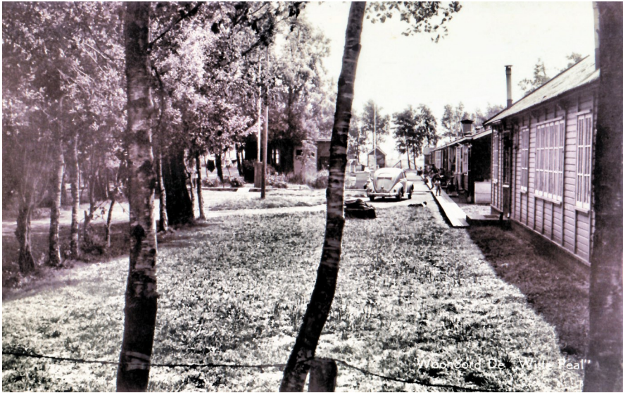
DWP in 1959.

Westerbork. Van daar gingen ze verder naar Duitsland waar hen een gruwelijk lot in concentratiekampen wachtte. Waarschijnlijk heeft niemand van die 120 mensen het overleefd.