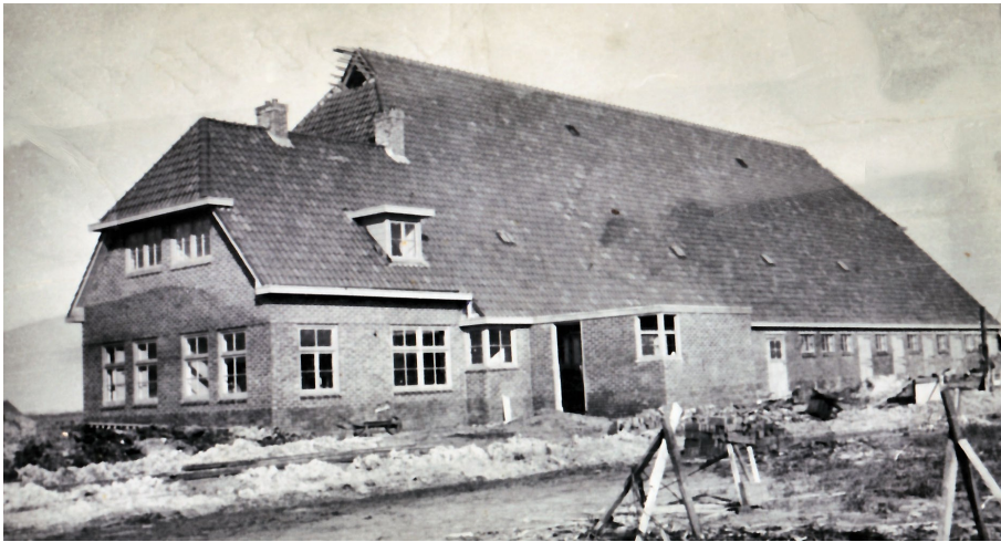
De nieuw gebouwde boerderij van Klaas Eefling.

verbouwd konden worden. Twee boerderijen verrezen in het nieuwe landschap. Gebouwd door werkloze bouwvakkers. Op een ervan kwam Klaas Eefling terecht als boer. Hij was opzichter bij de ontginning en liet weten dat hij wel boer wilde worden op de boerderij in aanbouw. Dat lukte na