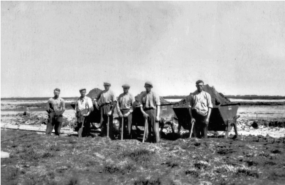
De verveners in actie. Links staat de opzichter Klaas Eefting.