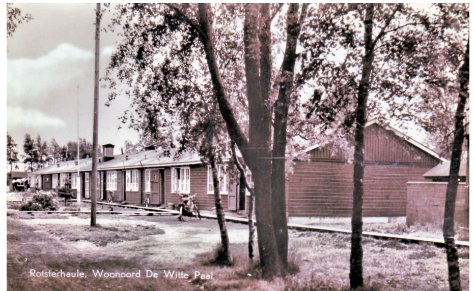
Rotsterhaule, Woonoord De Wite Peal

uitvoeren. Merkw aardigerwijze hoefde dat niet want een nieuwe melding van de Hoofdinspecteur van dezelfde Rijksdienst van 3 okt. was dat in de nacht van 2 op 3 oktober alle joden uit DWP waren overgebracht naar