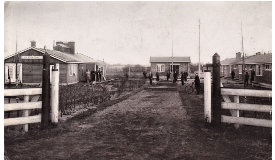
DWP in ongeveer 1941.