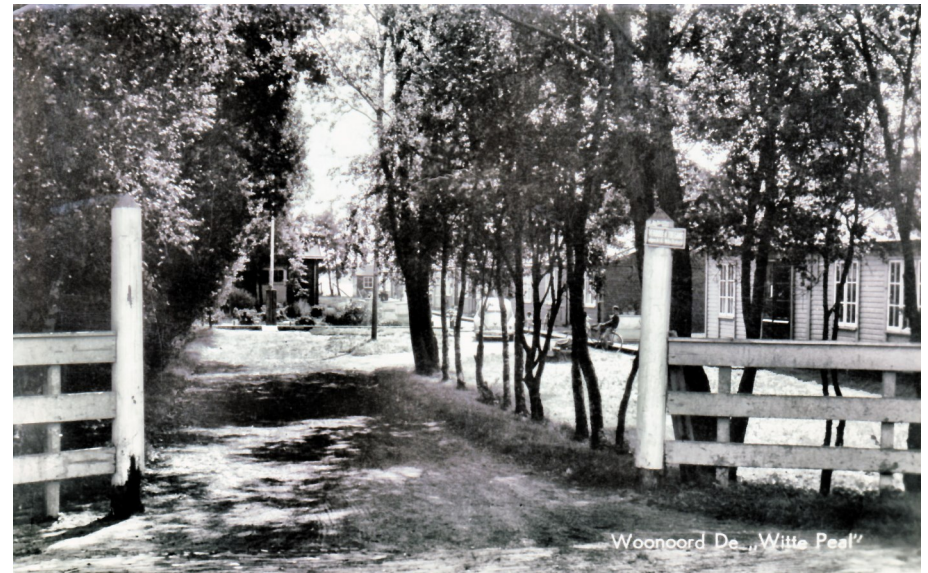
DWP in de bomen met het bordje 'verboden toegang.'

een selectieprocedure en een paar jaar later in 1942 kocht hij het boerenbedrijf. Hij was een akkerbouwer. Een bezoeker van de streek vertelt in 1940 via de krant dat deze grond "van oneindig hoger nut" was, dan die waterplas van voorheen. "Men moet dit ten volle beamen wanneer men ziet, welke hoeveelheden bieten, aardappels en bietenloof de laatste dagen van de boerderijen werden gehaald". Er scheen toen dagelijks een grote drukte van boerenwagens te zijn. Ook op stro en