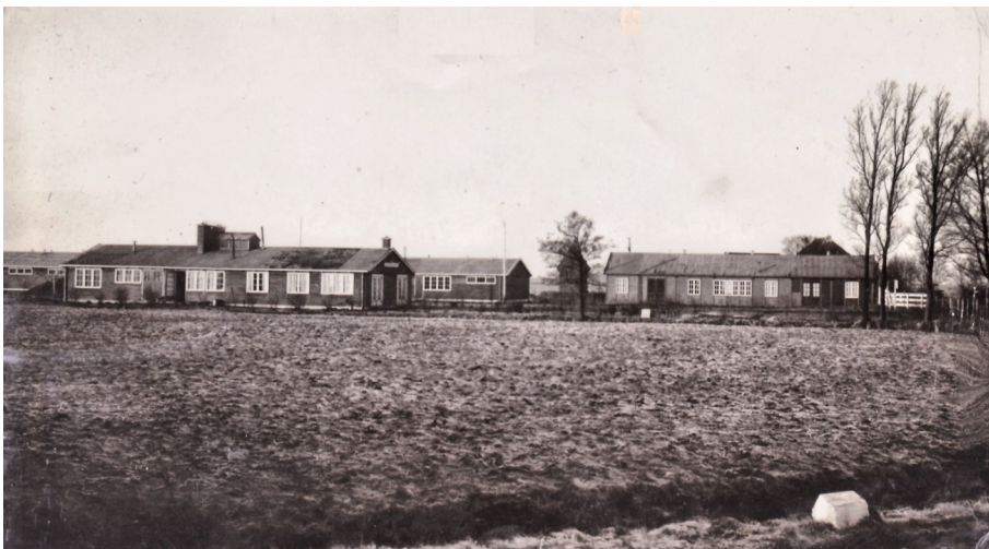
Het kamp 'De Wite Peal' in ongeveer 1941.

een selectieprocedure en een paar jaar later in 1942 kocht hij het boerenbedrijf. Hij was een akkerbouwer. Een bezoeker van de streek vertelt in 1940 via de krant dat deze grond "van oneindig hoger nut" was, dan die waterplas van voorheen. "Men moet dit ten volle beamen wanneer men ziet, welke hoeveelheden bieten, aardappels en bietenloof de laatste dagen van de boerderijen werden gehaald". Er scheen toen dagelijks een grote drukte van boerenwagens te zijn. Ook op stro en