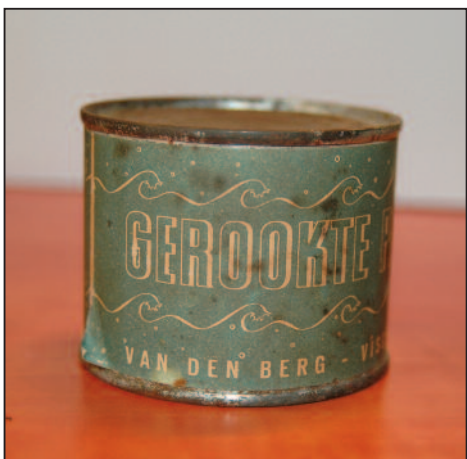
Blikje gerookte paling