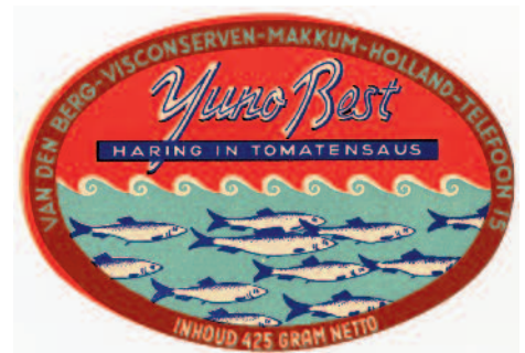
Etiketten van conservenproducten.